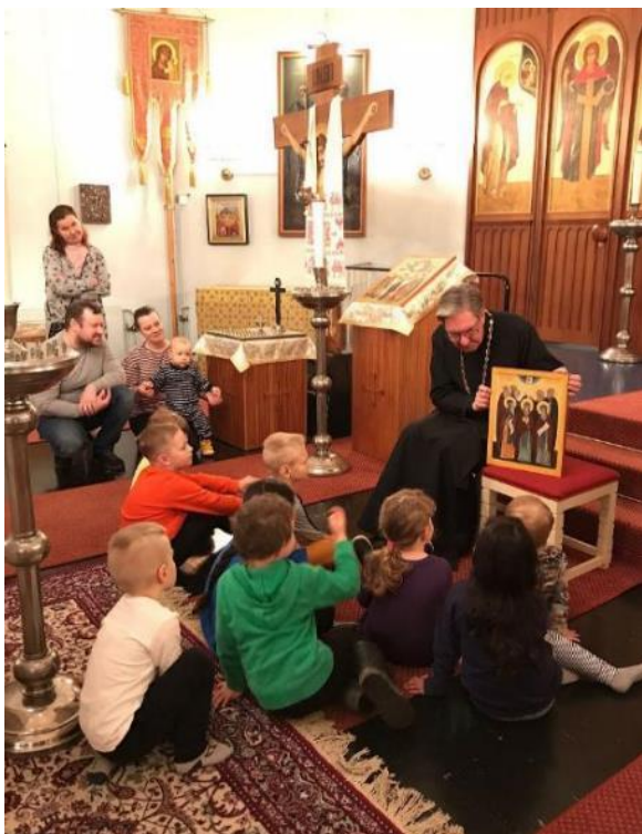
Lapsiperheet kokoontuivat tiistaiseuran iltatilaisuuteen Rautalammilla.