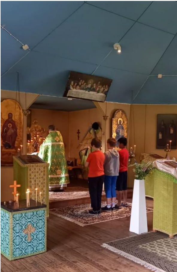
Kaikkien leiri Puroniemessä.

Kesäkuussa Puroniemessä pidettiin kaikkien leiri, koululaisten puuhapäivä Suonenjoen kirkon pihamaalla lokakuussa, perheiden kokoontuminen sekä mummojen lauantai Rautalammillä.