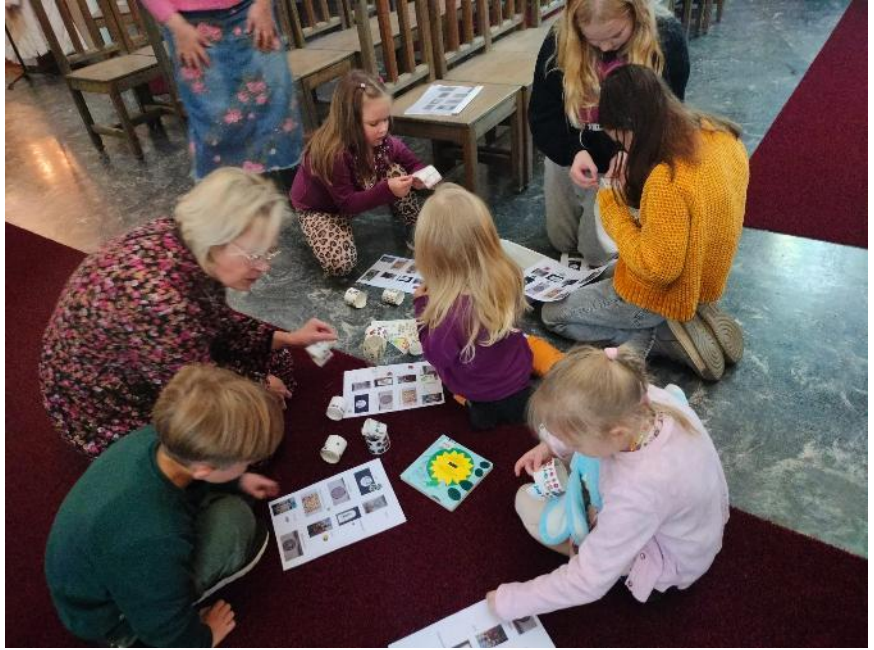
Kuva lasten tapahtumasta Iisalmessa 22.11.2025.

Koululaispalveluksia järjestetään erityisesti kirkkaalla viikolla. Pääsiäisliturgiat toimitettiin Iisalmessa, Kiuruvedellä ja Lapinlahdella. Näihin palveluksiin kutsuttiin alueiden ortodoksioppilaat. Iisalmeen tuli oppilaita myös Sonkajärveltä. Liturgian jälkeen oli ruokailu.