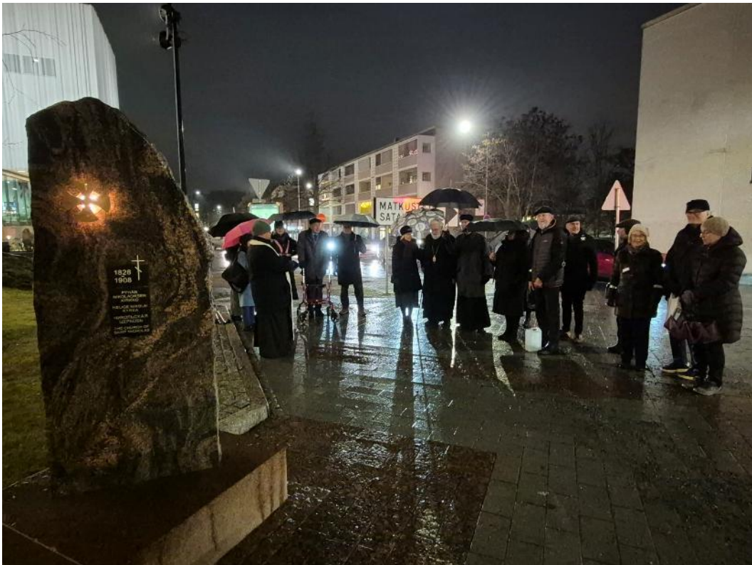
Kuopion ensimmäisestä ortodoksisesta pyhäköstä kertova muistomerkki asennettiin perjantaina 31.10. Maaherrankadun ja Kauppakadun kulmaukseen, jossa pyhäkkö palveli kuopiolaisia ortodokseja yli 70 vuoden ajan. Muistomerkki pyhitettiin 6.12.2026.