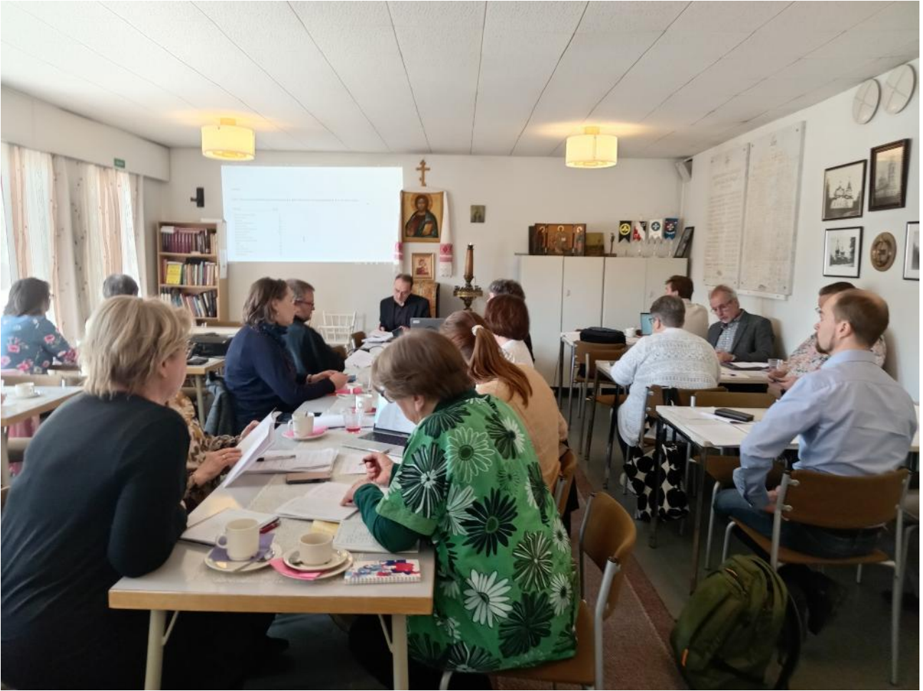
Seurakunnanvaltuuston 2. kokous Rautalammilla 17.5.2025