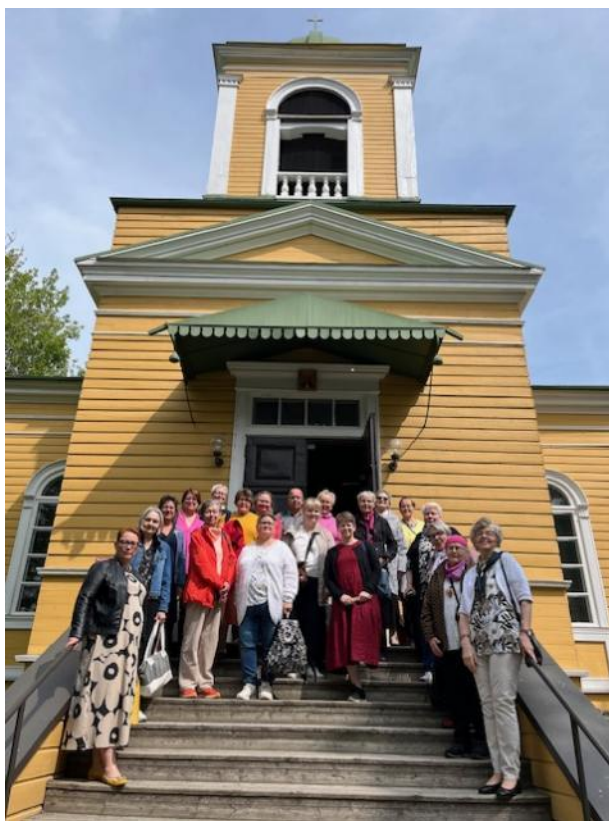
Kuvat kirkkokahveilta ja helluntain retkeltä Savonlinnaan.