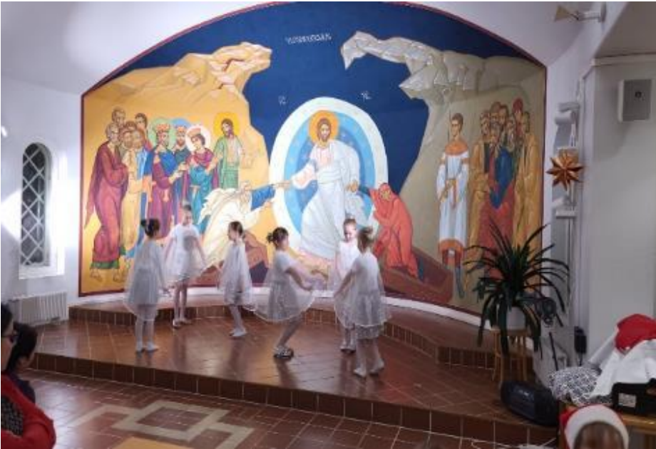
Kerhojen joulujuhla 14.12.