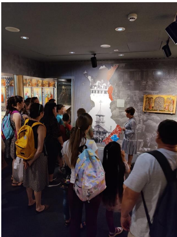
Ukrainalaisia tutustumassa Riisaan kesällä 2022.

Vuonna 2020 alkanut koronapandemia vaikutti vielä vuoden 2022 alussa. Venäjän helmikuun lopussa 2022 aloittama hyökkäyssota Ukrainaan näkyi seurakunnan toiminnassa. Seurakunnassa on venäjää puhuvia seurakuntalaisia ja työntekijöitä, joiden avulla auttamistyötä pystyttiin järjestämään pian sodan alkamisen jälkeen ja sotaa pakenevien tullessa seurakunnan alueelle. Rahallista tukea saatiin niin yksityisiltä ihmisiltä kuin eri yhteisöiltä sekä kirkollishallitukselta.