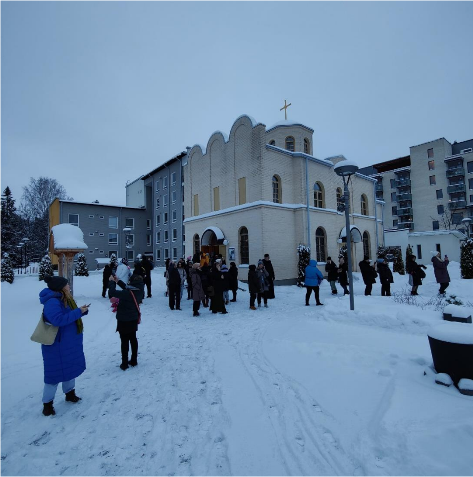
Tutustumista Joensuun seminaariin.