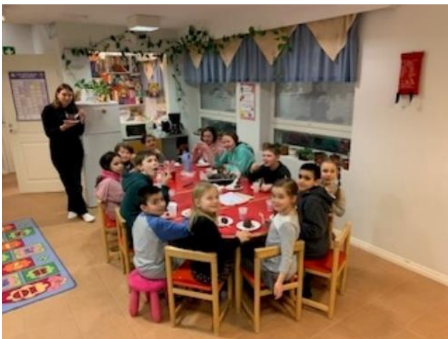
Iltapäiväkerho Kuopiossa.