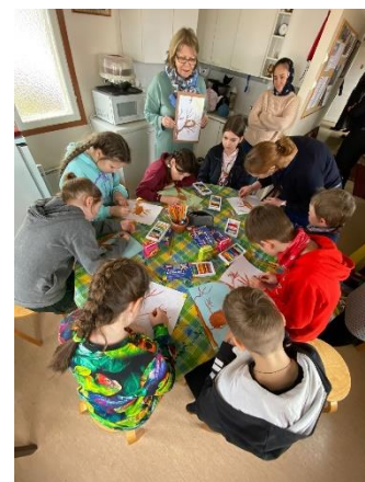
Kuvia Karvoskylän Samovaari kerhon Pääsiäisjuhlasta 2022