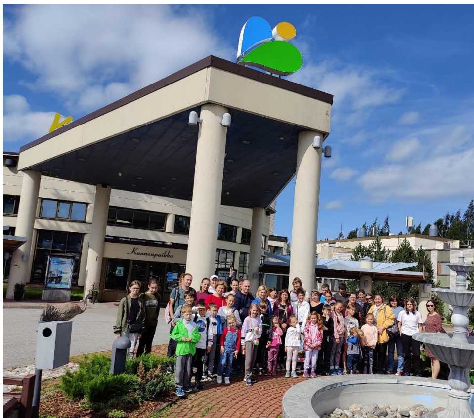
Retki Kunnanpaikkaan kesällä 2022

Kirkollishallituksen lisäksi tukea saatiin yksityisiltä lahjoittajilta. Esimerkiksi Kuopiossa sijaitseva Minna Canthin koulu päätti lahjoittaa taksvärkkirahat seurakunnan järjestämään toimintaan ukrainalaisille. Nämä varat käytettiin kesätoimintaan ukrainalaisille perheille.