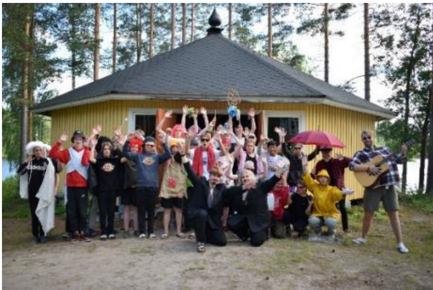
Kripa 1 vauhdissa.

Kripa 1 (30.6.–8.7.), Purniemi, 26 leiriläistä (22 poikaa, 4 tyttöä), pappi isä Jelisei Rotko ja kanttori Eija Honkaselkä, johtaja Iris Mikkonen sekä 12 ohjaajaa.