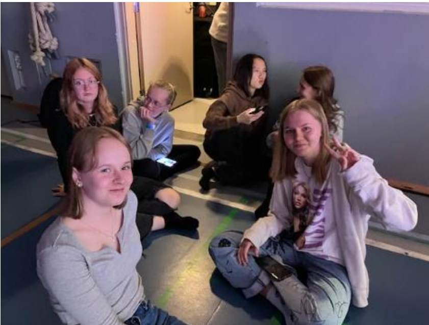
Kulmakivi festarit Jyväskylässä 7-9.10. Kuopio-Team.