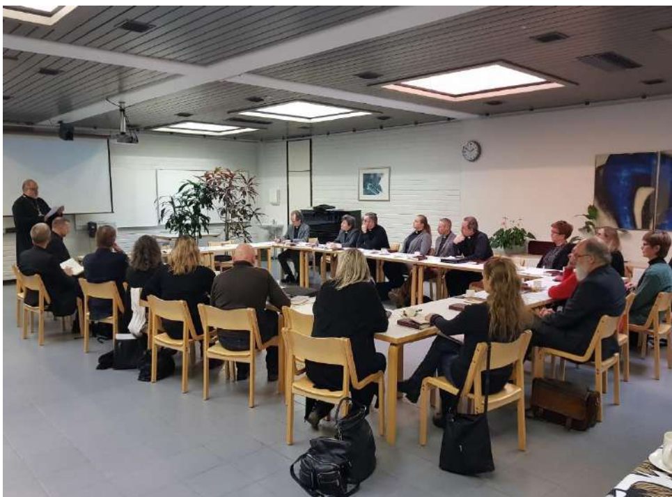
Ehtoollisvieraanvaraisuus-seminaari.