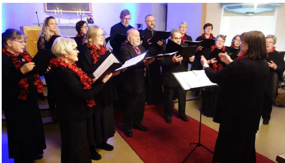
Siilinjärven ja Mihailan kuorotkonsertissa Syvänniemellä 30.12.2018.