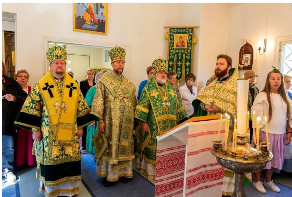
Piispallinen liturgia pt. Arseni Konevitsalaisen kirkossa.

Siilinjärven ja Pielaveden tiistaiseura ovat saman ikäisiä. Siilinjärvellä juhlittiin seuran 70-vuotista taivalta marraskuussa piispa Arsenin toimittamalla liturgialla Suurmartyyri Georgios Voittajan kirkossa sekä päiväjuhlla.