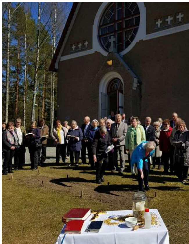
Kylvönsiunaus Vehmersalmella helatorstaina.