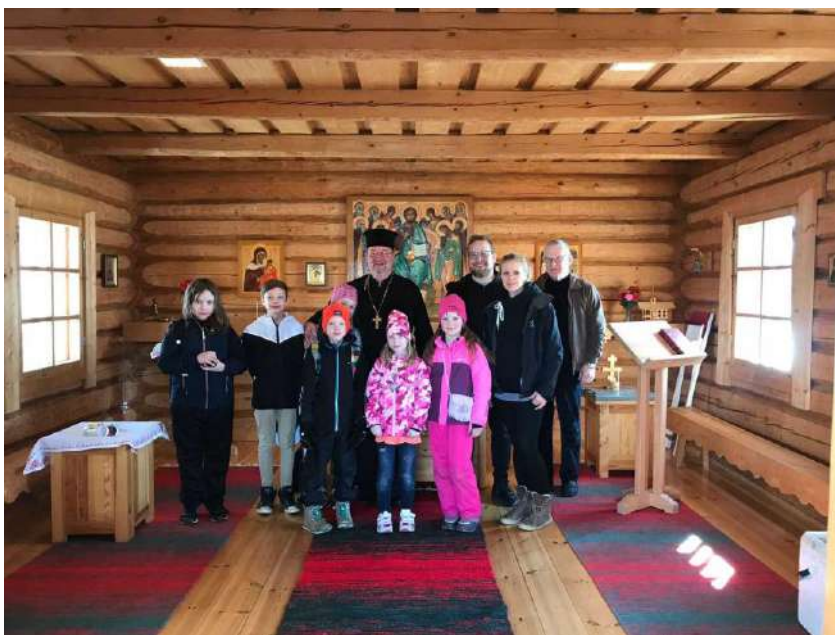
Koululaisia Luikonlahden tsasounassa 27.4.2018

Virpovitsojen siunaukset suuren paaston aikana ennen palmusunnuntaita Muuruveden koululla ja Kaavin koululla.