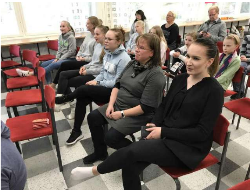
Syysähinät Nilsissä 28.9.2018