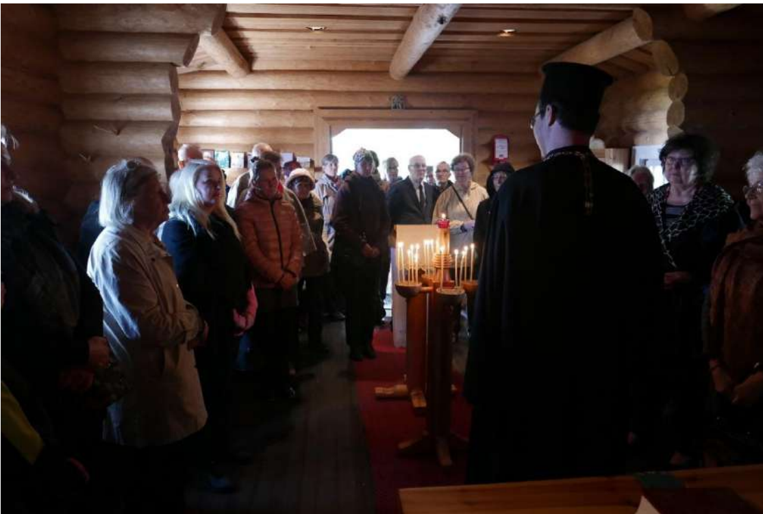
Syysretkeläisiä Nurmeksen Bomballa.