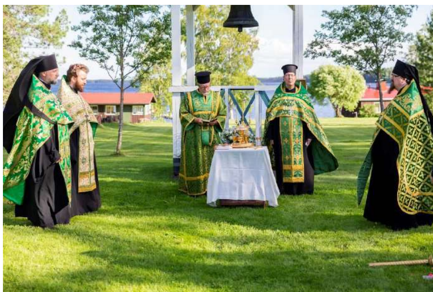
Praasniekan suuri ehtoopalvelus toimitettiin Hiekan tilalla.