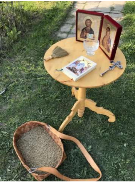
Kylvön siunaus 22.5.2018