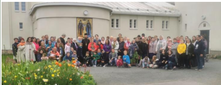
Retkellä oli mukana 120 henkilöä!